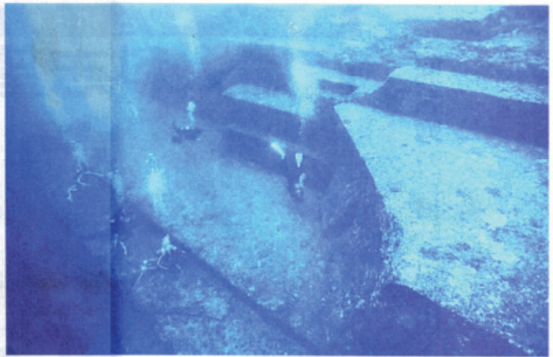
ダイビングスポットにもなっている「海底遺跡」のメインテラス (新斎嘉八郎さん提供)