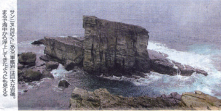
サンニヌ台近くにある「軍艦岩」は巨大な岩塊。まるで海中から岸上してきたように見える。