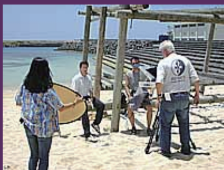
久部良ナーマ浜でクラウド支局長のインタビュー風景