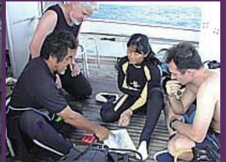
遺跡ポイントのブリーフィング