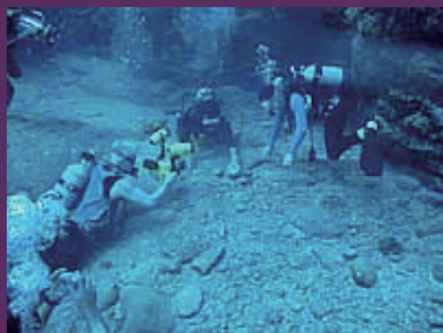
城門の前で石を使って説明中