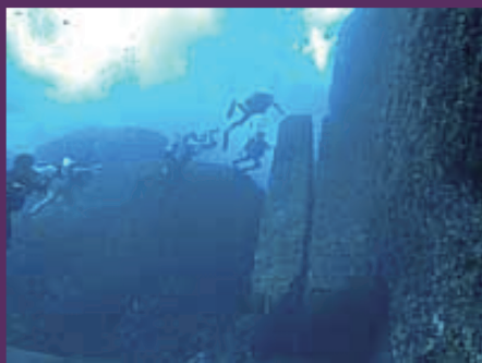
城門をぬけると目の前には2枚岩